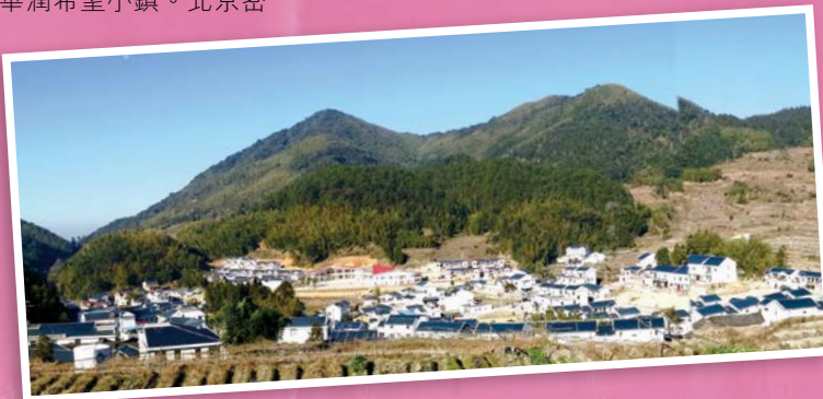
福建古田華潤希望小鎮

2008年起，華潤集團陸續在中國的貧困地區選址建設希望小鎮。通過統一規劃，就地改造、重建，徹底改變農民的居住環境，同時利用華潤集團的產業和資源優勢，幫助農民成立專業合作社，把華潤希望小鎮建設成為一個生態、有機、綠色、和當地自然環境保持和諧一致，具有農業發展活力、鮮明地方特色和民族特色的新農村。至今，華潤集團已建成廣西百色、河北西柏坡、湖南韶山、海南萬寧、福建古田華潤希望小鎮。北京密雲、貴州遵義、安徽金寨華潤希望小鎮正在規劃建設中。未來，華潤集團還將中國的貧困地區建設更多的希望小鎮。